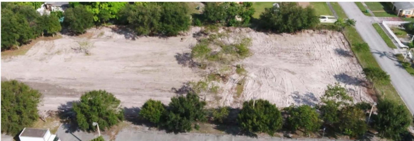
IMAGEN SUPERIOR. Recepción 150 camiones de material (ROCKFIL) para la compactación del terreno e inicio de obra civil. IMAGEN INFERIOR. Foto aérea del Terreno, víspera de la reubicación y la poda de árboles, 3400 - Miami Gardens.